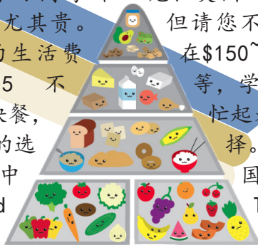
THE RABBIT FOOD PYRAMID

Davis 镇里的中国餐馆不少，比如说Hometown、Old Tea House等。但是中餐到了美国，味道或多或少会有些调整，以适应美国顾客的口味。此外，Downtown 还有一些韩国、泰国、越南、